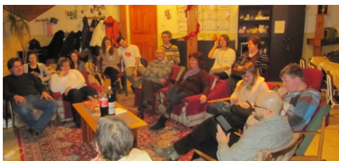
Ako povedať „NIE“ bez pocitu viny