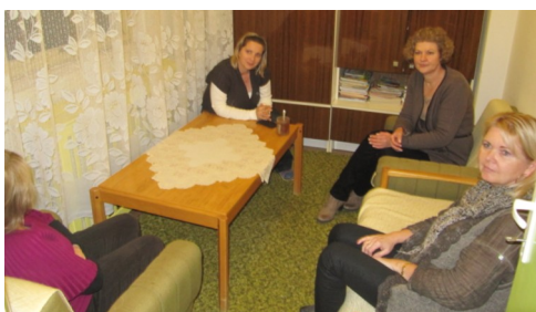
Beseda - MŠ Hurbanova