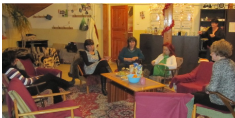
Beseda - MŠ Sládkovičova

Projekt bol podporený Islandom, Lichtenštajnskom a Nórskom prostredníctvom Programu Aktívne občianstvo a inklúzia, ktorý realizuje Nadácia Ekopolis v spolupráci s Nadáciou pre deti Slovenska a SOCIA - nadácia pre sociálne zmeny.