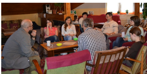
Beseda - Internet, PC a závislosti